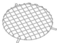
306 Grille de protection - Cripto medium