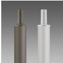
1509 Mât strié Ø120