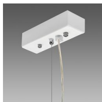
Suspension électriflée - 5 pôles