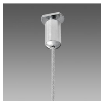
Suspension simple acier