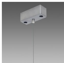
Suspension simple Q