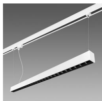
Raccord en suspension pour rail