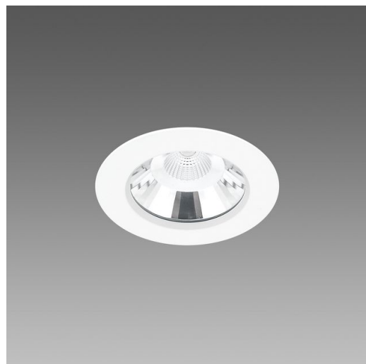
Jet 140 - IP65